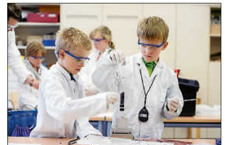
Im Kurs „Sicher experimentieren im Chemielabor“ wird aus Rotkohlsaft eine Indikatorlösung zubereitet.

www.hector-kinderakademie.de www.kinderakademie-badsaulgau.de