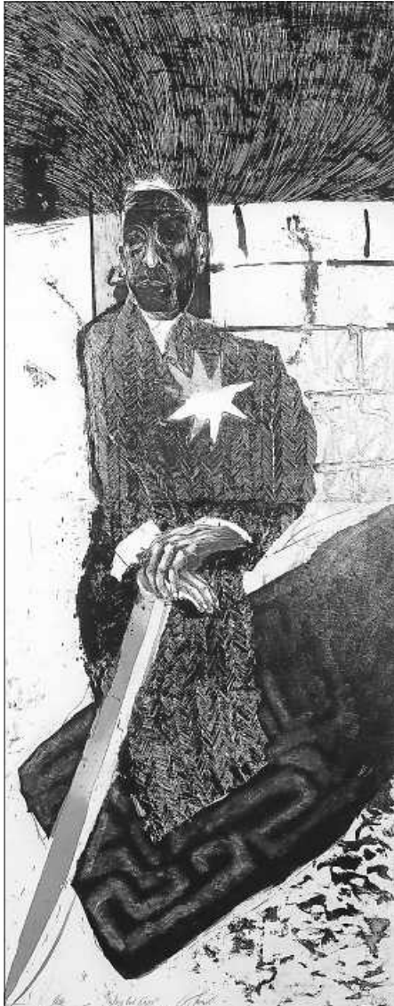
Jorge Luis Borges

trauert - versteht sich als Hommage an die aufklärerische Kraft der Kunst und zeigt, dass die jahrhundertalte Technik der Radierung noch längst nicht an ihrem Ende angekommen ist.