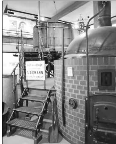
Sudhaus im Museum

ist beschränkt, eine vorherige Anmeldung wird empfohlen, Tel. 07581 207-161, während des Museumsbetriebes Tel. 07581 537344.