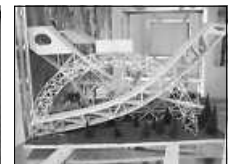
Beispiel Bauwerk 2