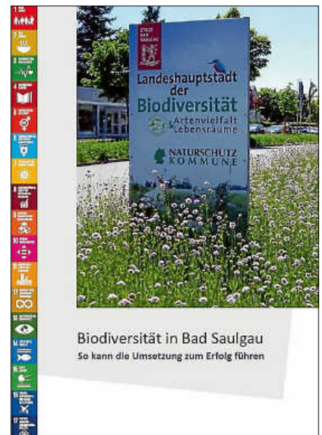
Biodiversität in Bad Saulgau So kann die Umsetzung zum Erfolg führen