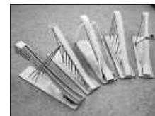
Beispiel Bauwerk 1