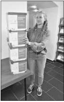
Vier volle Boxen in vier Wochen