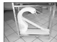
Beispiel Bauwerk 3