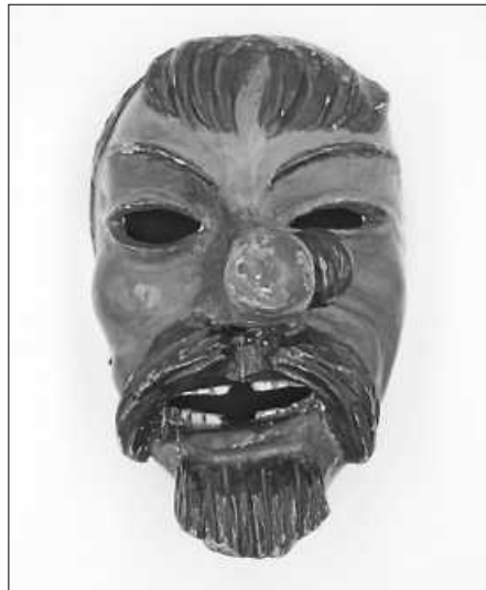
Die „Maske mit der Pflaume“