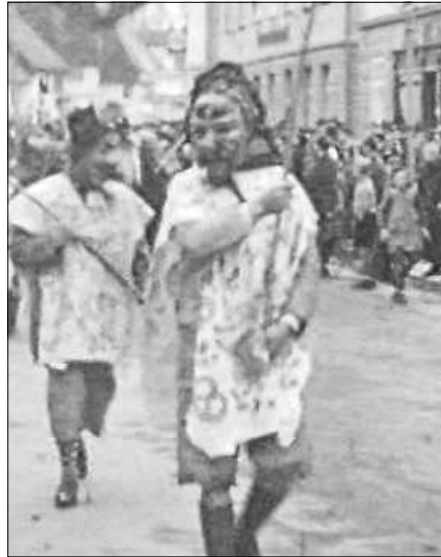
Die „Maske mit der Pflaume“ beim Umzug 1938 in Saulgau