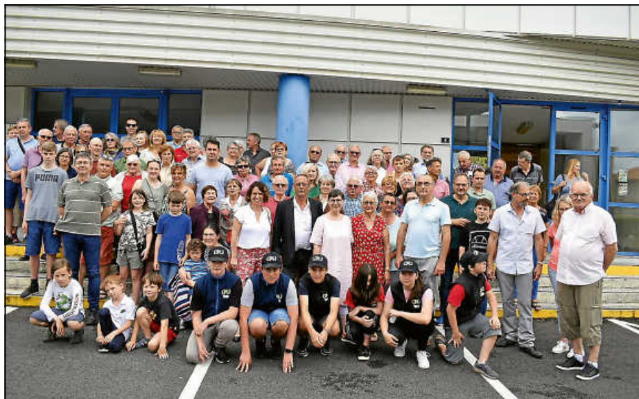
Gemeinsames Foto von Bad Saulgauer und Chalaiser Freunden der Partnerschaft

Seit 1981, dem Jahr der Unterzeichnung des Partnerschaftsvertrags zwischen dem damaligen Saulgau und der Gemeinde Chalais im Südwesten Frankreichs, haben mit großer Regelmäßigkeit gegenseitige Besuche in den verschwägerten Städten stattgefunden. Nach zweijähriger coronabedingter Unterbrechung sind knapp vierzig Freunde der Städtepartnerschaft über das Pfingstwochenende nach Chalais aufgebrochen. Dort wurden sie mit viel Herzlichkeit empfangen und erlebten ein Programm, das kulturelle Angebote, Naturerlebnisse und kulinarische Höhepunkte vereinte.