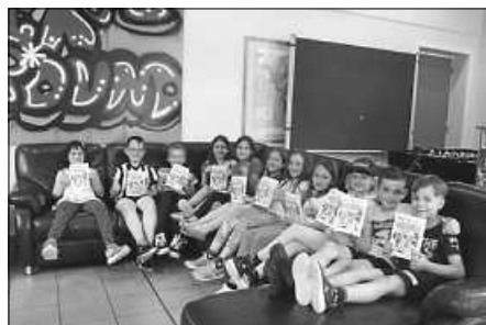
Die Kinder der Ferienzeitbetreuung freuen sich auf den Sommerferienspaß 2022.