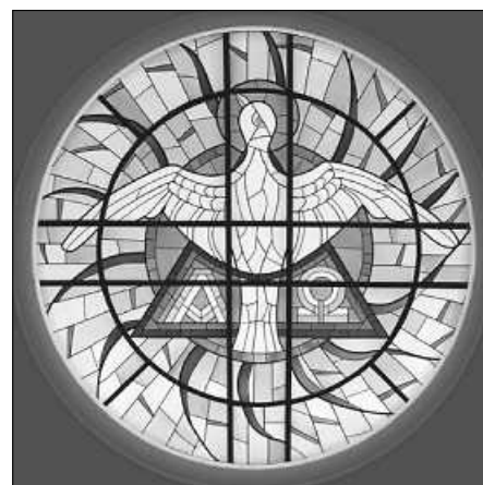
in: Pfarrbriefservice.de Foto: Martin Manigatterer/Kunst: Glaswerkstätten im Stift Schlierbach/ Standort Fatimakapelle Schardenberg

Wir beten für eine Kirche, die treu und mutig das Evangelium verkündet, eine solidarische Gemeinschaft ist, jeden willkommen heißt und in einer Atmosphäre der Synodalität lebt.