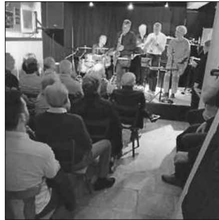
Konzert im Jazzkeller

Und wenn dann erstmal angeheizt ist, kann die Jam-Session starten!