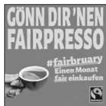
Fairtrade Deutschland hat den Februar als Fairbruary ausgeschrieben. Dieser Monat steht im Zeichen „Einen Monat fair einkaufen“. Seit dem 1.2.2024 sind auf der Website www.fairbruary.de vier Challenges zu finden, um in 29 Tagen zum Fairtrade-Profi zu werden.

Ein ganzer Monat Zeit zum Üben, wie die Welt ein Stück weit fairer gestaltet werden kann - ohne etwas aufzugeben.