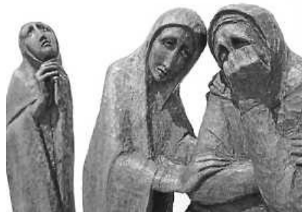
in: Pfarrbriefservice.de Foto: Hildegard Hendrichs (Skulptur) Peter Weidemann (Foto)

40 Prozent der Sammlung verbleiben in den Kirchengemeinden für ihre sozialkaritative Arbeit. Der andere Teil geht an verschiedene Dienste und Projekte der Caritas in den jeweiligen Caritas-Regionen und an den Sozialdienst katholischer Frauen e.V. (SKF). In den Gottesdiensten in den Kirchengemeinden wird für das Fastenopfer gesammelt.