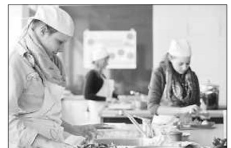
Klasse 1BK2P testet alternative Proteinquellen.

Bewerbungen für das Berufskolleg I und II (Wirtschaft und Pflege) für das Schuljahr 2024/25 sind bis zum 1. März 2024 online möglich unter www.schule-in-bw.de/bewo . Weitere Informationen sind auf https://hws-badsaulgau.de/service/anmeldung-bewo/ zu finden.