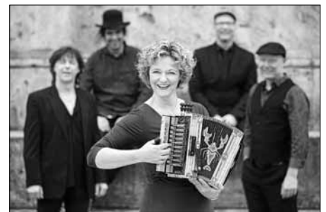
"Zydeko Annie & Swamp Cats" entführen die Zuhörer mit ihrer Cajun- und Zydekomusik nach New Orleans.

Karten im Vorverkauf bei Augenoptik Nerlich (07581 7041) kosten 13 €, an der Abendkasse 15 €. Mitglieder des Jazzvereins zahlen im Vorverkauf 10 € und an der Abendkasse 12 €.