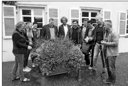
Die Thüringer bewundern die mit Gewürzen, Kleingemüse und Kleinobst bestückten Pflanzkübel der „Essbaren Stadt“.