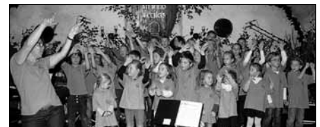
Wieder mit dabei - der Kinderchor Bolstern.

Bald ist es wieder soweit. Am 15./16. September findet wieder das Bolsterner Weinfest statt.