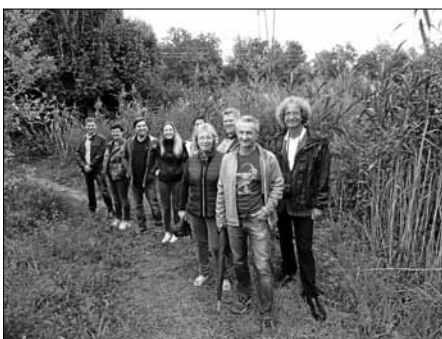
Die Delegation in der städtischen Biotopanlage Krähbachtal