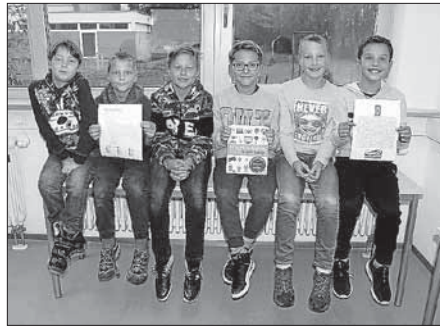
Die Teilnehmer der "Kunterbunten Medienwerkstatt" 2018