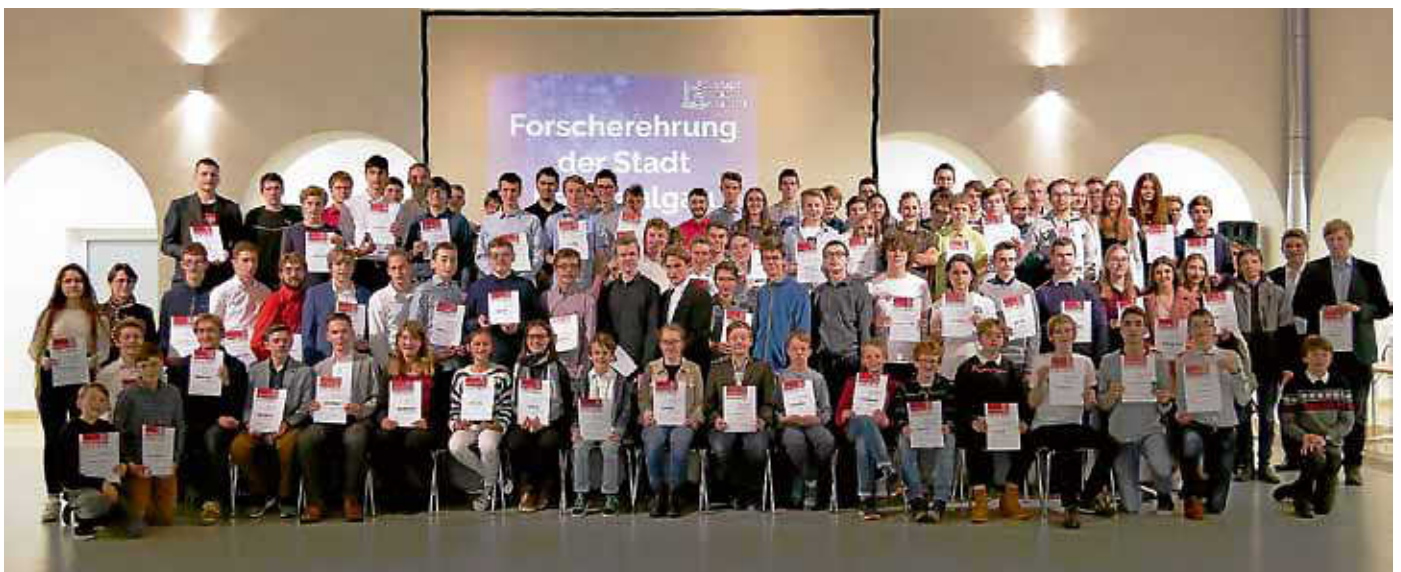
Geballte MINT-Kompetenz: 146 Nachwuchsforscherinnen und Nachwuchsforscher des Schülerforschungszentrums erhalten eine Auszeichnung der Stadt Bad Saulgau.

Vertrieb: G.S. Vertriebs GmbH, Josef-Beyerle-Straße 2, 71263 Weil der Stadt, Tel.: 07033 6924-0, E-Mail: info@gsvertrieb.de , Internet: www.gsvertrieb.de