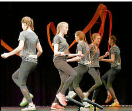
Rope-Skipping-Gruppe des SV Braunweiler / Sportlerehrung 2019

Die Corona-Pandemie hat in diesem Jahr auch die Sportwelt lahmgelegt. Seit Ausbruch der Pandemie konnten keine Wettkämpfe mehr ausgetragen werden. Aus diesem Grund hat sich die Stadtverwaltung schweren Herzens dazu entschieden, die Sportlerehrung der Stadt Bad Saulgau, welche jedes Jahr im Herbst durchgeführt wird, abzusagen. Selbstverständlich findet aber im kommenden Jahr wieder eine Sportlerehrung statt. Zu dieser werden auch die Sportler/-innen eingeladen, die in diesem Jahr für Erfolge an Wettkämpfen, die seit der letzten Sportlerehrung im Herbst 2019 durchgeführt wurden, geehrt worden wären. Das Organisationsteam der Stadtverwaltung freut sich jetzt schon auf eine Sportlerehrung und ein Wiedersehen im Jahr 2021.