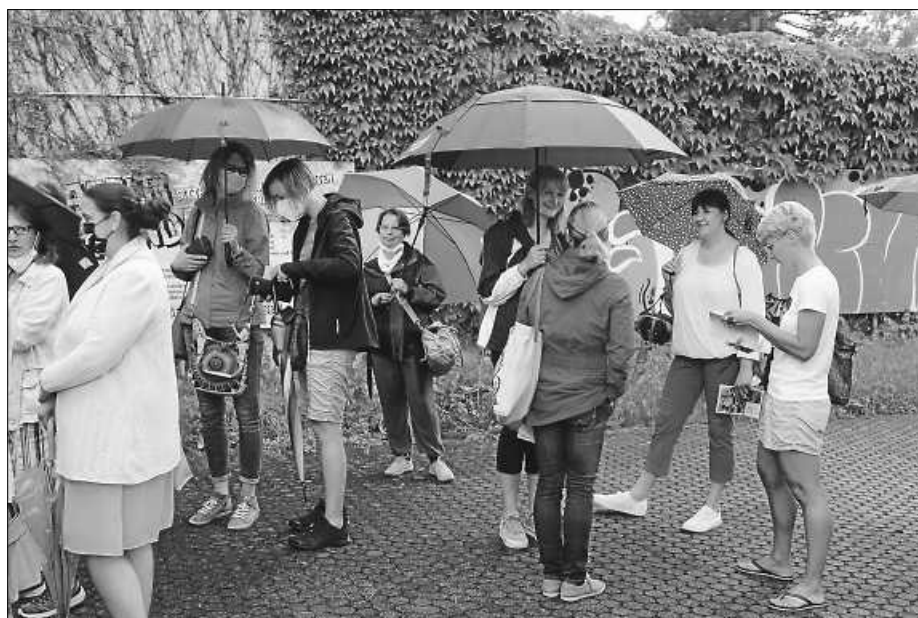
Gute Laune trotz Regen beim ersten Anmeldetag des Sommerferienspaßes 2021