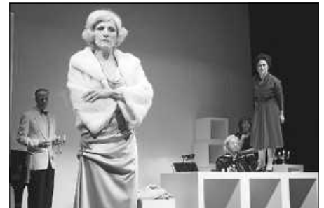
Spatz & Engel

Etwa Daniel Kehlmanns Drama „Reise der Verlorenen“ oder das Musik-Stück „Spatz und Engel“ über die schwierige Beziehung der beiden Superstars Marlene Dietrich und Edith Piaf. Der Spielplan liegt ab sofort in Buchhandlungen, Banken, im Alten Kloster, der Tourist-Info sowie im Rathaus aus.