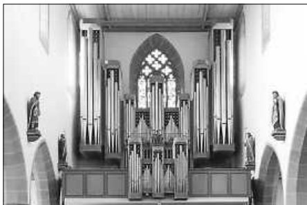
Klais Orgel in der Stadtpfarrkirche Bad Saulgau

Beten wir, dass alle Getauften für das Evangelium eintreten und bereit sind für die Sendung eines Lebens, das die Freude an der Frohen Botschaft bezeugt.