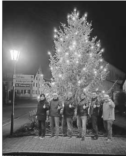
Christbaumsingen mit den „Singenden Männern“