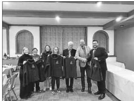
Übergabe der Spende durch die Josef Rack GmbH an den Trachtenverein