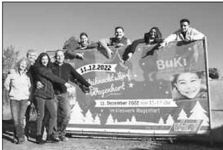
Organisationsteam von Weihnachtsdorf Kieswerk Wagenhart und die Vorstände von Buki

Weitere Informationen gibt es unter www.weihnachtsdorf-wagenhart.de .