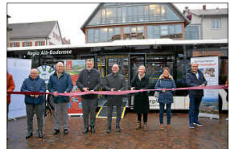
Offizieller Start der Regiobuslinie 800 auf dem Marktplatz Bad Saulgau

Am 2. Dezember 2022 wurde im Haus am Markt in Bad Saulgau die neue Regionalbuslinie 800 eingeweiht. Ab 11.12.2022 wird die Linie im Stundentakt zwischen Bad Saulgau und Pfullendorf verkehren. Sie ist neben der Linie Pfullendorf – Krauchenwies – Sigmaringen (Teilstrecke Regionalbus 500) sowie der Linie Sigmaringen – Inzigkofen – Meßkirch (Regionalbus 600) eine weitere Hauptachse im Landkreis.