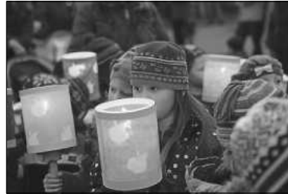
Pfarrbriefservice.de Foto: Annette Zoepf/Kindermissionswerk

Seelsorgeeinheit Sankt Johannes Baptist Bad Saulgau