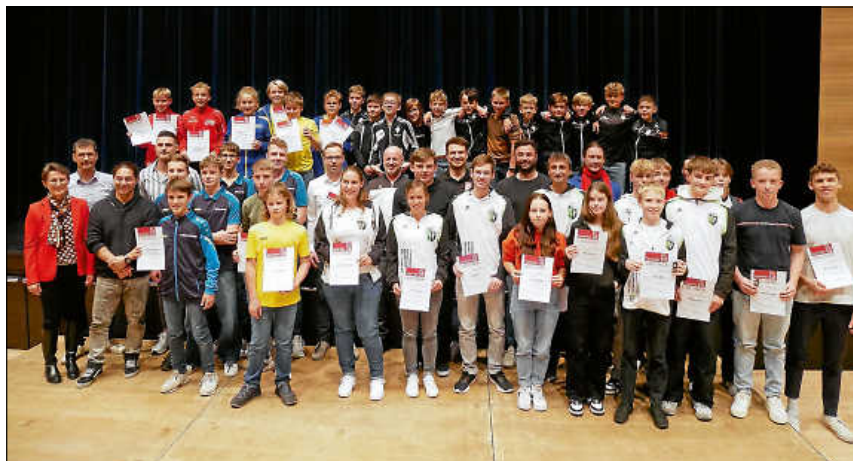
Insgesamt 30 Teams, Sportlerinnen und Sportler erhielten bei der Sportlerehrung 2023 Auszeichnungen für besondere Leistungen.