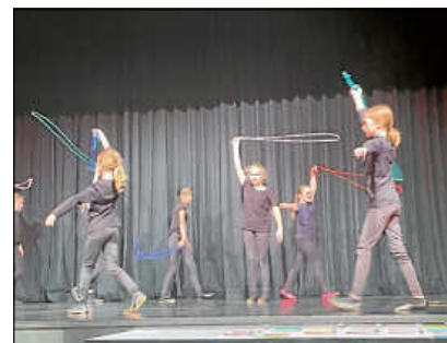
Für den sportlichen Rahmen sorgten fast schon traditionell die Mädchen von der Rhythmischen Sportgymnastik (TSV Bad Saulgau).